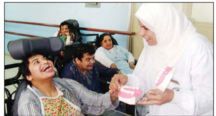
• فحص الأسنان