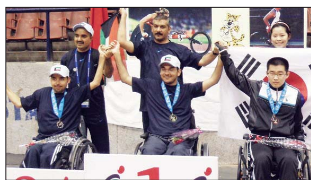
• تكريم بطل تنس الطاولة