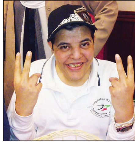
• إحدى المشاركات في معرض طموحي يهزم إعاقتي

إبداعات ذوي الاحتياجات الخاصة ليس لها حدود، فها هم يتبجحون باستمرار أنهم ذوو إرادة حقيقية وليست مجرد شعارات، وقد حقق كثير من ذوي الإعاقات ما عجز عنه الأصحاء في مختلف المجالات ولكن! لكن هذه تخفي وراءها غصة ومرارة، إذ أن الموهوبين والمخترعين والمبدعين من هذه الفئات يعانون تهميشاً وظلماً وعدم وجود جهات تدعم مبادراتهم وإبداعاتهم.