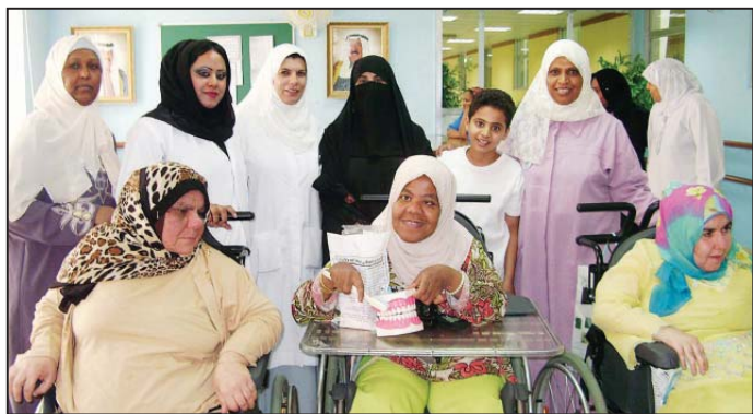
• المشاركون في المعرض مع المتطوعين